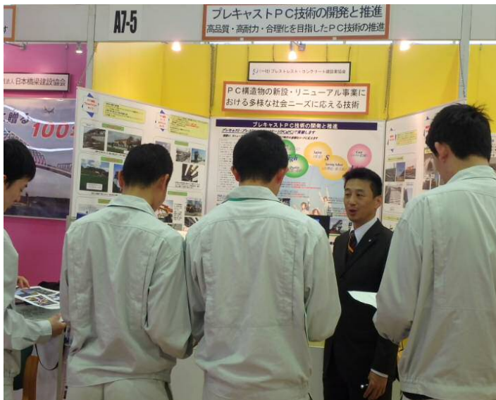
一般社団法人 プレストレスト・コンクリート建設業協会