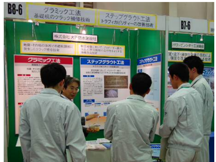
株式会社 大阪防水建設社