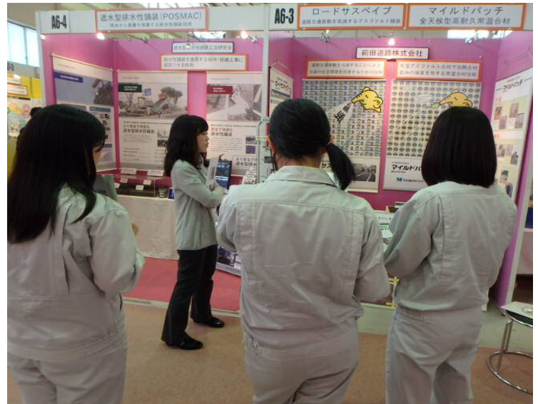
前田道路 株式会社