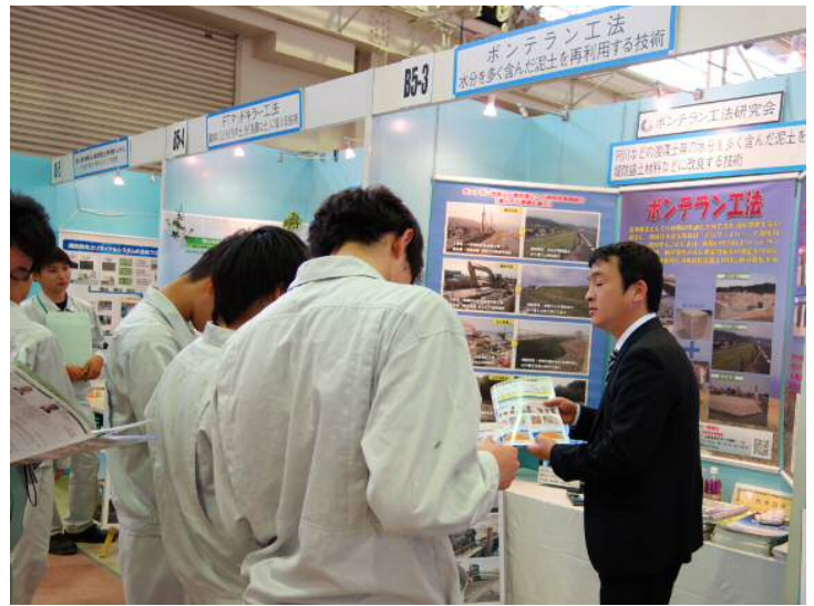
ボンテラン工法研究会