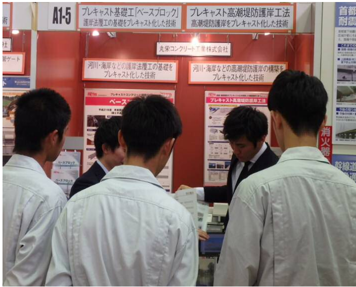
丸栄コンクリート工業 株式会社