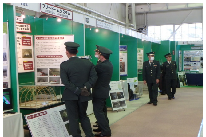
屋内展示場内の自由見学