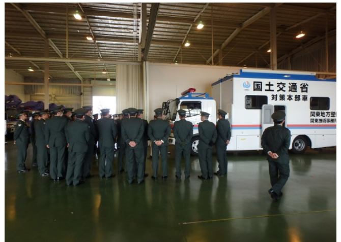
災害対策車両の説明