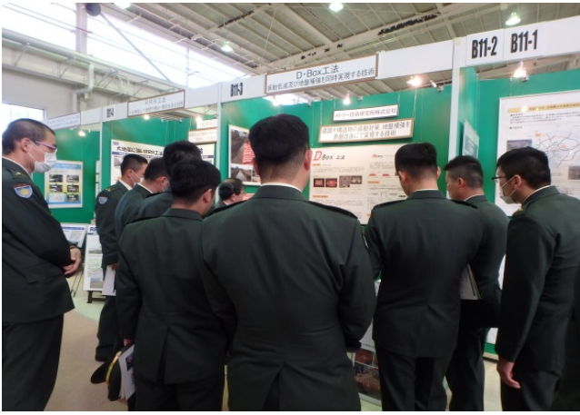
メトリー技術研究所 株式会社