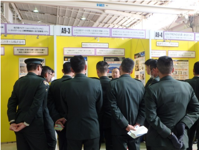
株式会社 トプコンソキアポジショニングジャパン