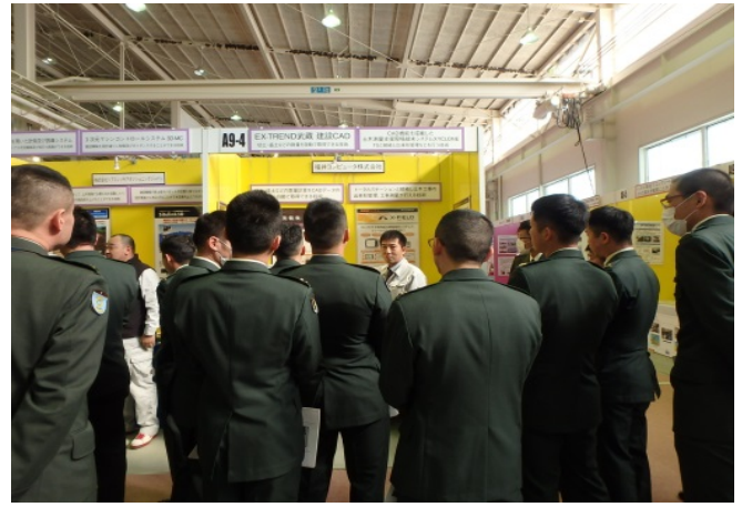
福井コンピュータ 株式会社