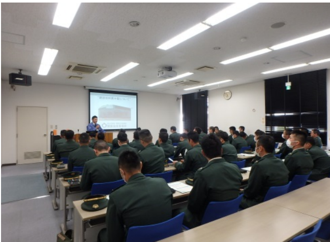
全 体 説 明